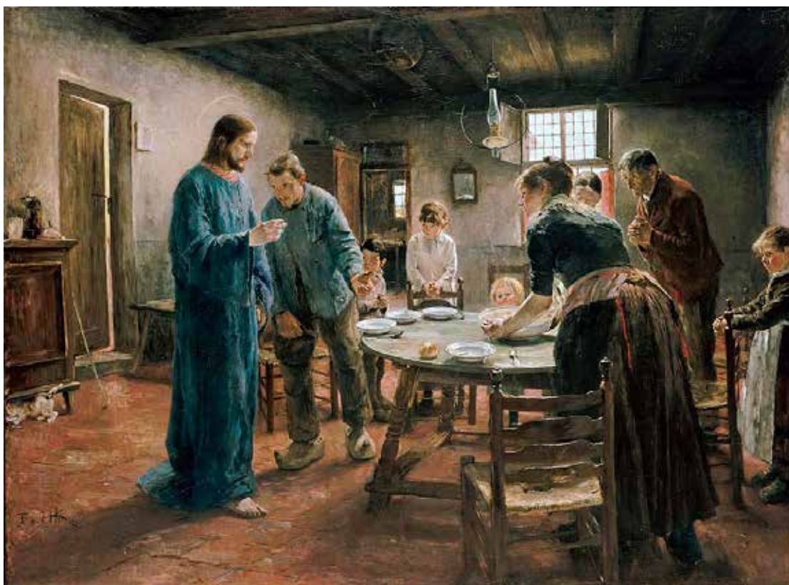
Das Tischgebet («Komm, Herre Jesu, sei unser Gast»), malt av Fritz von Uhde, 1885.

For noen år siden ble jeg stående og måpe en lang stund foran dette maleriet i Berlins gamle nasjonalgalleri. Blant annet fordi det er ganske stort (165 cm bredt, 130 cm høyt), og svært realistisk malt, kan tilskueren lett få en følelse av å bli dratt inn og være til stede i samme rom som personene på bildet. Det gjør et mektig inntrykk, for hvem er det som plutselig har kommet inn i huset til en helt vanlig tysk bondefamilie «her og nå», som er klare for å sette seg til bords for å spise et måltid mat? Det er jo Jesus! Mannen ved siden av ham sier visst «Kom og vær gjesten vår, Herre. Du kan sitte her,» mens Jesus tydeligvis er klar til å lede familien i en bordbønn.